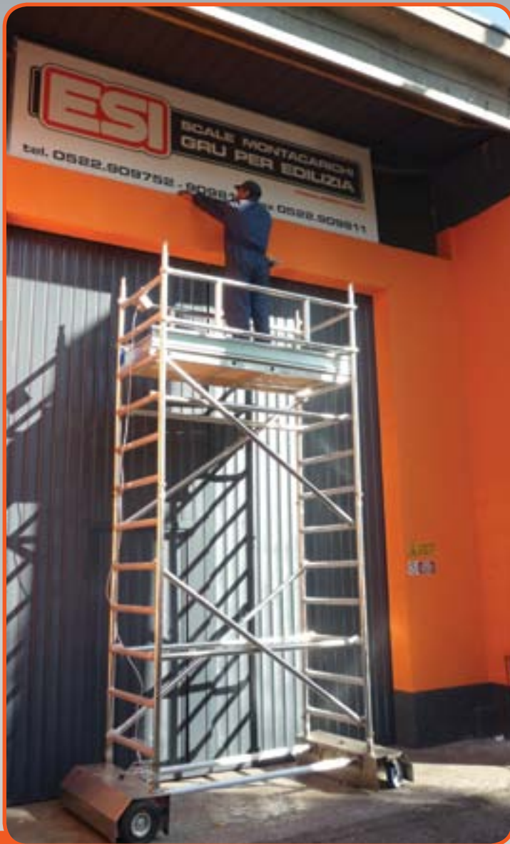
Il trabattello al lavoro